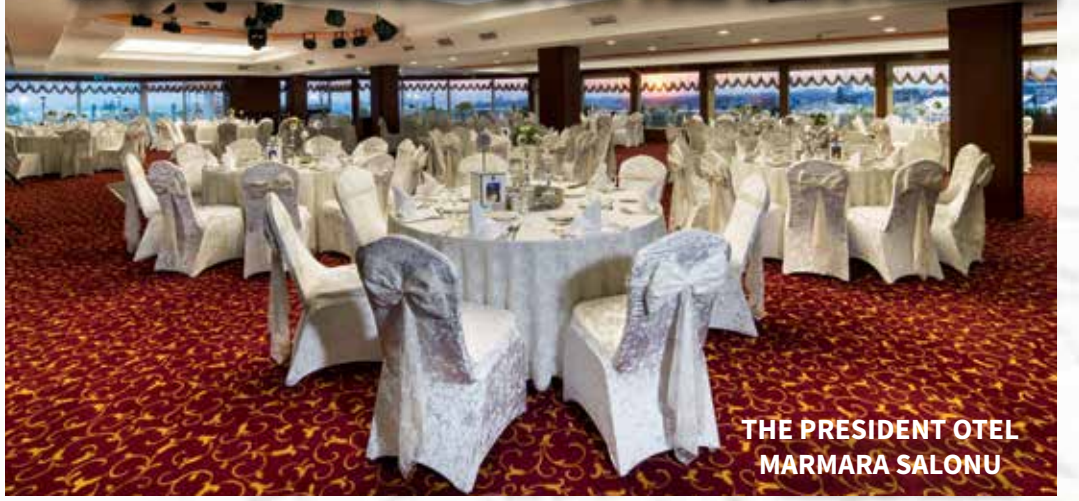
THE PRESIDENT OTEL MARMARA SALONU

BEST WESTERN OTELLER ZİNCİRİNE BAĞLI THE PRESIDENT OTEL VE CITADEL OTEL, YILLARDIR BEYAZIT VE SULTANAHMET SAHİLİNDE İSTANBULLULARIN EN ÖZEL DAVETLERİNE EV SAHİPLİĞİ YAPIYOR.