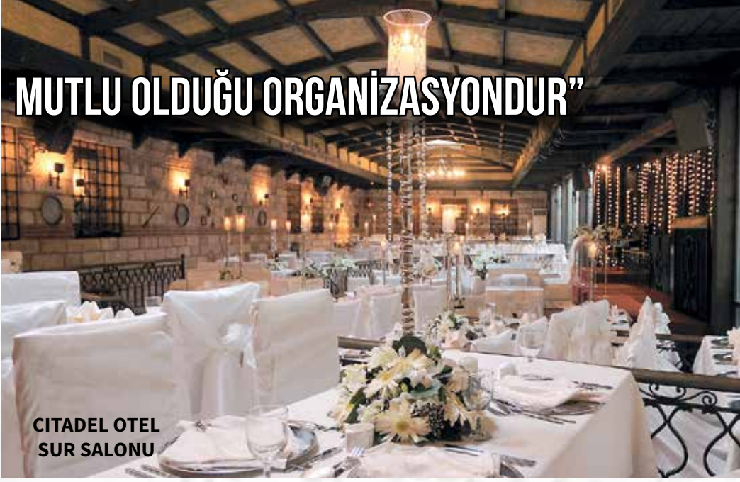
CITADEL OTEL SUR SALONU