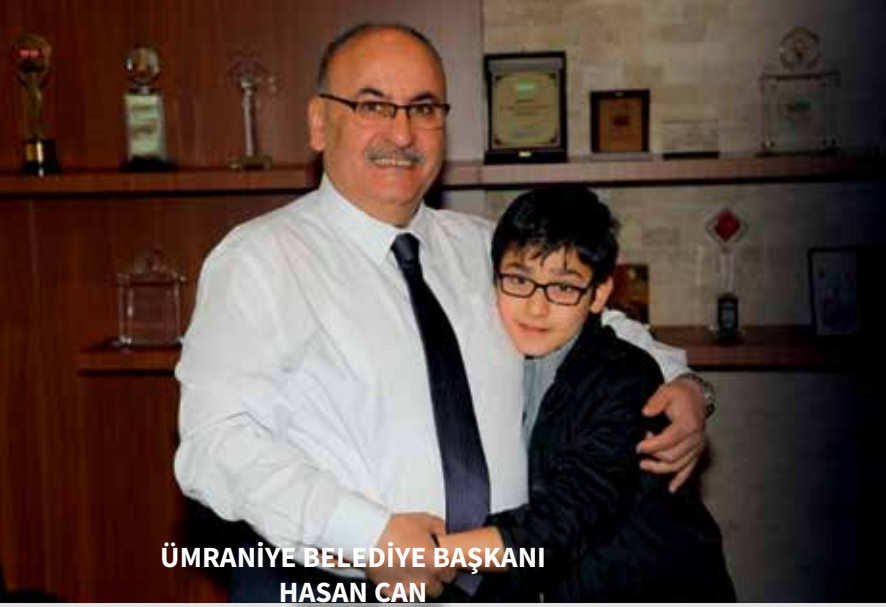
ÜMRANİYE BELEDİYE BAŞKANI HASAN CAN