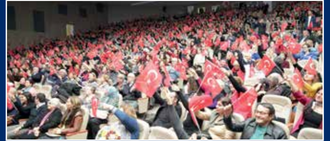
ÇANAKKALE KONSERİ İZLEYİCİLERİ 1.500 KİŞİLİK SEYİT ONBAŞI KONFERANS SALONU'NU DOLDURDU.

Avrupa Konutları Müsiki Topluluğu 14. konserini Çanakkale'de verdi. “Çanakkale Zaferi'nin 102. Yıldönümü Anma Konseri” Çanakkale Onsekiz Mart Üniversitesi İçdaş Kongre Merkezi ÇOMÜ Seyit Onbaşı Konferans Salonu'nda gerçekleşti. “Mayadağ'dan Kalkan Kazlar, Alişimin Kaşları Kare” gibi Atatürk'ün sevdiği şarkılar ve kahramanlık eserlerinin seslendirildiği konserde salon doldu taşıtı. Seyirciler şarkılara ellerinde Türk bayrakları ile eşlik etti. “Çanakkale İçinde” türküsü seslendirilirken duygulu anlar yaşandı.