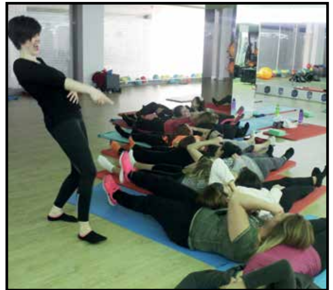
KAHKAHA YOGASI'NDA SEBEPSİZ, RİTMİK GÜLÜŞLER YERİNİ İÇTEN VE UZUN KAHKAHALARA BIRAKTI.

Tema İstanbul Club House'da nefes dersine katılan komşular kahkaha yogası ile birbirlerinin karınları üzerine yatarak sırayla sebepsiz ve ritmik güldüler. Bir süre sonra bu gülüşler yerini içten ve uzun kahkahalara bıraktı. Tema İstanbullu hanımlar dersi stres atarak keyifle tamamlamış oldular.