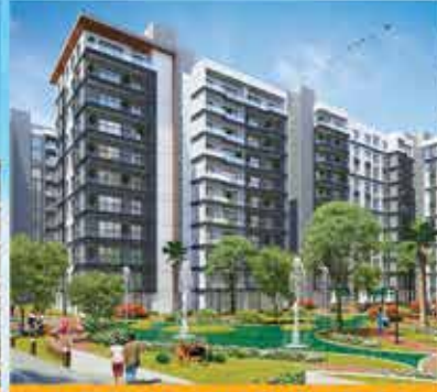
AVRUPA KONUTLARI ATAKENT 4