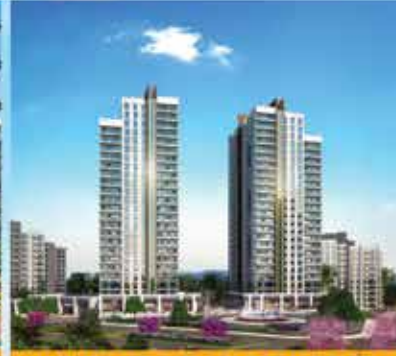
AVRUPA KONUTLARI BAŞAKŞEHİR*