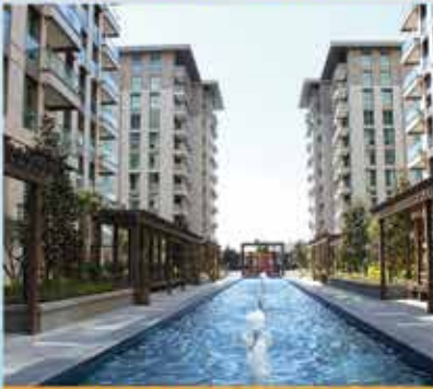
AVRUPA KONUTLARI KALE