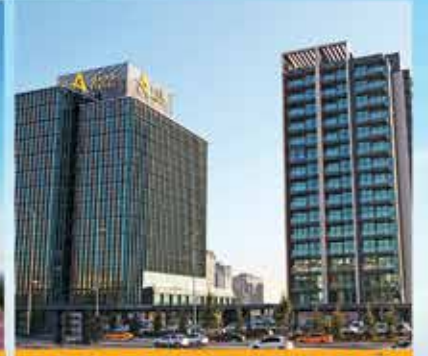
AVRUPA RESIDENCE-OFFICE ATAKOY