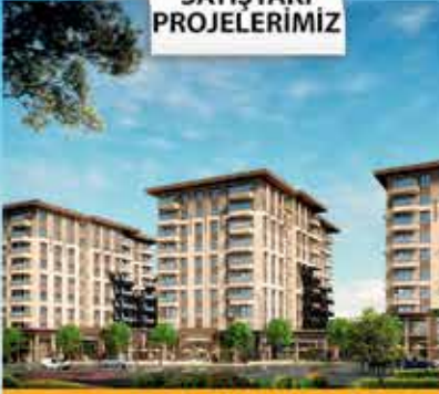
AVRUPA KONUTLARI KALE 2